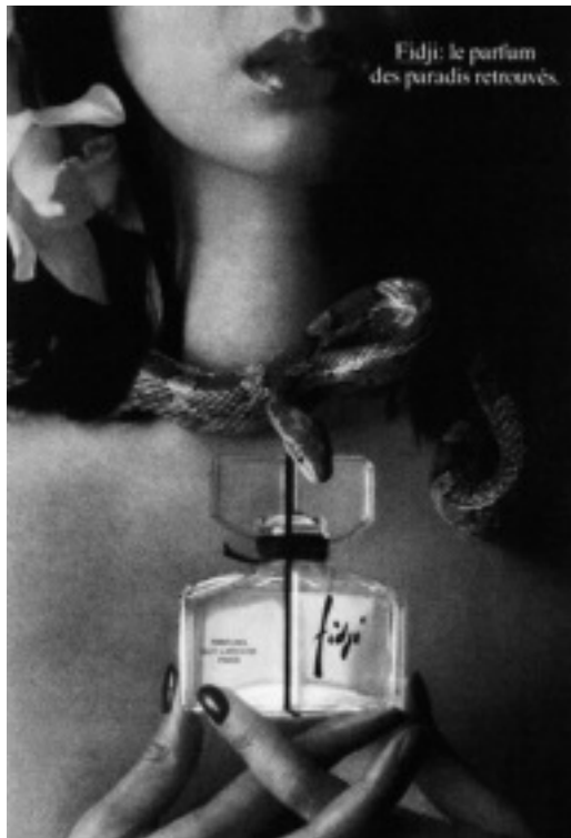
〈図3〉 FIDJI の広告