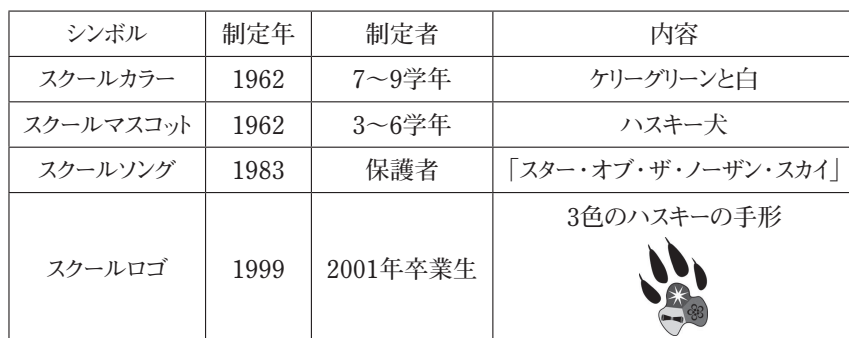
表3 HISのスクールシンボル

これらのシンボルは、HISにおいてスクール・スピリット (愛校心) として捉えられている。HISのことは「ハスキーズ」 (Huskies) と呼び、スクールグッズ (ユニフォーム、旗、およびイヤブックスなど) には、学校のシンボルカラーとしてスクールカラーのケリーグリーン (濃い黄緑