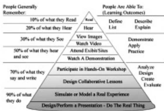
図2 経験の円錐 (流布版)