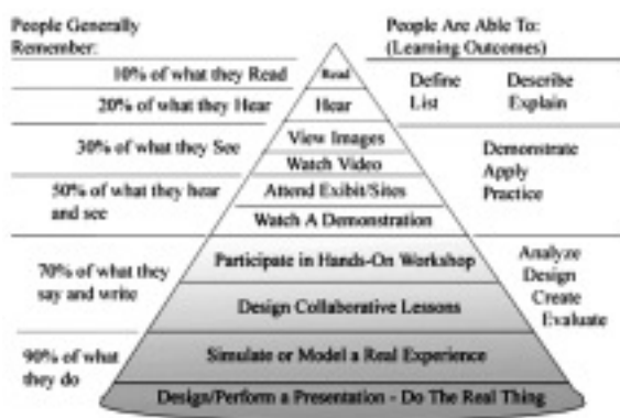
図2 経験の円錐 (流布版)