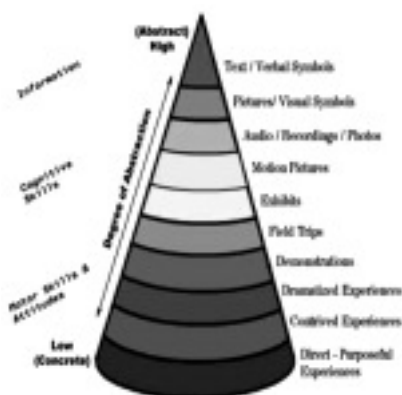
図1 デールの経験の円錐 (オリジナル)

記憶について、実験によって証明しようとしたものに、エビングハウスの忘却曲線がある (図