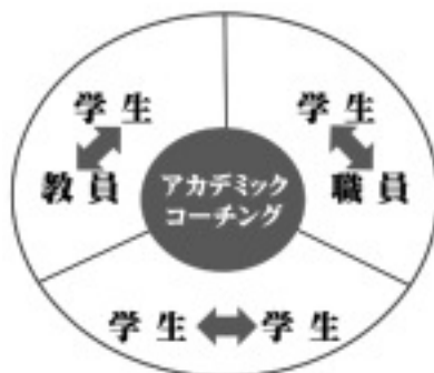
図7 アカデミック・コーチングの3領域

が、その役割はインターネットに取って代わられつつある。インターネット時代には、切磋琢磨の場を提供し、学生にやる気をおこさせ、共に新しい知識を創り出すコーチへと変わってきている。