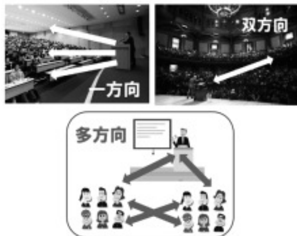
図6 講義の3スタイル

講義では、「脳みそに汗をかく」を講義全体の狙いとし、能動性と主体性を重視し、教師から学生への一方通行型スタイルではなく、教師と学生の双方向、それに学生間も加えて多方向型スタイルを試みた。ディスカッション、プレゼンテーション、ライティングを通して、毎回、学生の能動的な学習を促す際に、発言の仕方、文章の書き方において、コーチングのスキルを活用して、お互いに相手のやる気を引き出し、気付きをもたらすような表現方法を工夫するように指導した。互いのコメントによって学生が切磋琢磨することが目的であると明確に伝え、「教室は切磋琢磨の場」であることを意識させた。