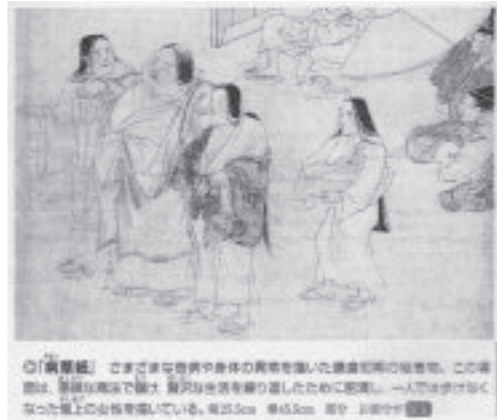
(出所) 詳説日本史図録編集委員会編(2016)「病草紙」『詳説・日本史図録 第7版』, 山川出版社, p.118.

一方、桜井英治(2015)によると、この重商主義の時代、金持ちがあらわれる一方、破産者も出現していたとある (27) 。