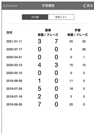
a 学習履歴トップ画面