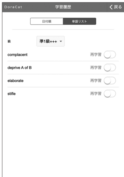
c 級レベルによる履歴