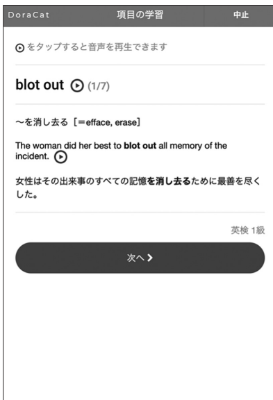
b 学習対象項目の確認