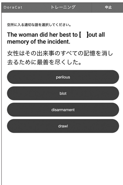
d 語句トレーニング 3