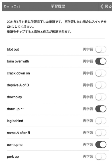
b 学習日による履歴