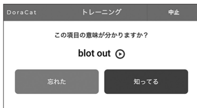
c 語句トレーニング 1 と 2