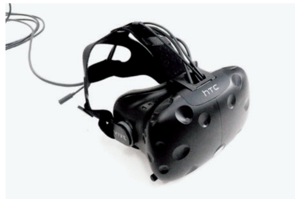
図 1 htc Vive Head Mount Display

さらに頭の動きと異なるレンダリングによる問題が指摘されている。頭部の動きを HMD のセンサーが検知してディスプレイ上で再描画を行う際に、描画の遅れやがたつきなどが発生することで原因となることが知られている。これまで述べて