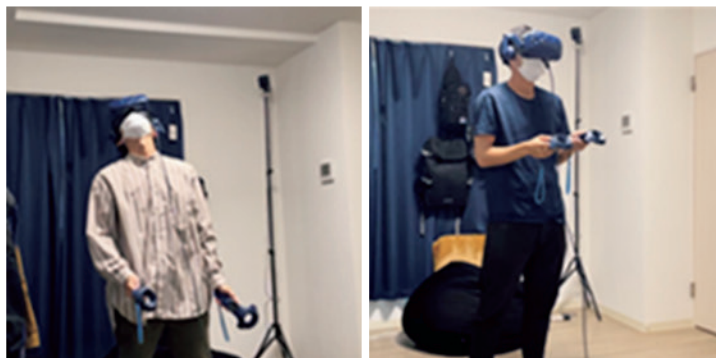
図3 実験をしている被験者の様子