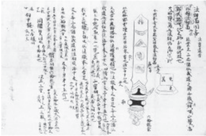
図2、真福寺蔵『法釵図聞書』（真福寺蔵善本 叢刊、神道篇第2巻『麗氣記』、法藏館、 二〇一九より転載）

そこで小稿では、法釵図を核として、高野山を中心とする新たな密教神話の構築について概観する。