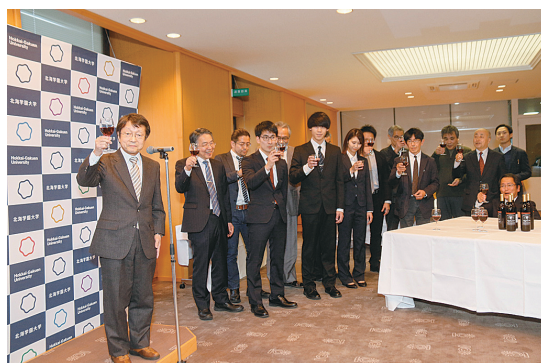
図2 学園オリジナルワイン報告会

成分分析を全工程で行うなど、多くのプロセスにおいて学生が主体的に取り組み、初の学園オリジナルワインが完成した。ラベルには各成分の分析値が並べて表示されている。