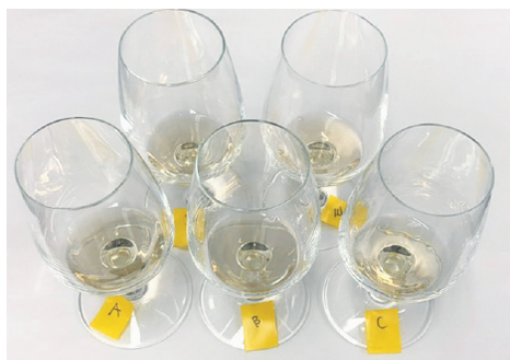
図5 官能試験の様子 同一のブドウ果汁を用い異なる候補酵母株を用いてワインを醸造し、比較・評価を行っている。

る。官能試験では、学生および教員だけでなく、八剣山ワイナリーのプロの方々にも参加して頂いており、プロにしか分からない僅かな差が感じられることが多々ある。そこで独自に発酵ぶどう果汁中の有機酸変化を高速液体クロマトグラフィー（HPLC）で調べたところ、株間で有機酸産生量に差があることがわかった。特に乳酸については官能試験（香り、味の評価）の結果と相関していることが確認できた。この手法により、酵母の特性をより定量的・客観的に評価できることが示唆された。