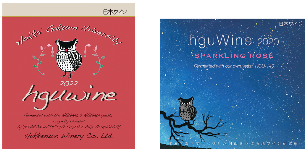
図6 学園オリジナルワインのラベル

(左) 2022年度学園オリジナルワイン赤、(右) 2020年度学園オリジナルワインスパークリングロゼラベルの中心のモチーフとなったシマフクロウは、国内では北海道と北方領土にのみ生息する鳥で、アイヌではコタンコロカムイ（集落を守る神）とよばれて最高位のカムイの一人として崇められており、また、西洋でも知恵・学問・芸術のシンボルとされている。さらに、スティールワインのラベルには、北海道の自然の恵みを表す「植物」と「果汁」、地域との連携を意味する「リボン」をラベル上部に配置した。