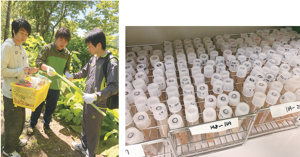
図4 サンプル採取中の学生と単離した酵母の一部

より醸造されたワインが注目されている。一方で、野生酵母は種類や性質を前もって選んで醸造に使用されているわけではないため、発酵が安定しない場合や、期待した味わいや香りを生み出せないことがある。一方、あらかじめ選抜されたワイン醸造に適した優良酵母である「純粋酵母」は、酵母の性質が保証され、生み出されるワインの味わいのある程度予測でき、発酵も安定していることから、多くのワインの商業生産現場において使用されている。しかし、ワイン醸造用の純粋酵母は海外産のものも多く、ワインで重要視される前述のテロワールという観点からは、もの足りなく感じられる。