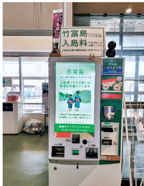
(写真1) 石垣港離島ターミナルに設置されている竹富島の入島料の自動支払機

もちろん、石垣島から竹富島までの船の運賃に入島料を上乗せして、乗船チケットを販売すれば、支払い率は100%となる。しかし、船の運航会社からすれば、入島料の運賃への上乗せは、チケット代の値上がりとみられ、さらに、それにより利用客が減少すれば、会社の売り上げも下がるということになるので、なかなか受け入れがたい施策となる。入島料をいくらに設定するのかということも、決して簡単な話ではなく、支払い率を向上させる方策とともに課題も多い。