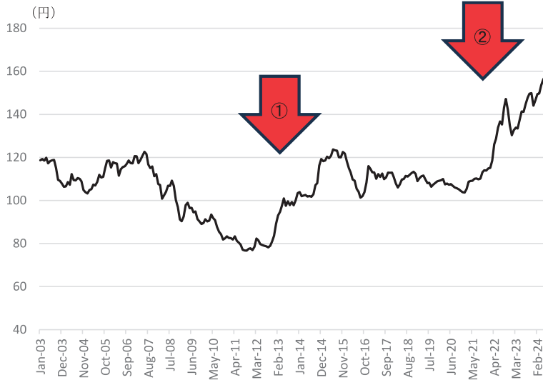
図表7 円ドル為替レート（月中平均） 2003年1月～2024年6月