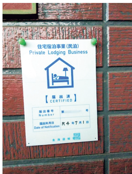
(写真2) 町長宅の民泊届け出証

この協定により、日本全国で初めて町長宅が民泊登録されたことで、メディアでも話題となった 34 。町長宅だけではなく、町役場の職員宅も民泊として登録、活用されている。公務員は、本来、副業ができないが、「働き方改革」による規制緩和により、清水町では町の職員が副業として民泊事業を行う。自治体職員が副業として自宅で民泊事業を行うのも、全国初の試みである。さらに、清水町は、町営の移住体験住宅もAirbnbに登録することで、ネットへの親和性が高い、若者へのアプローチも行っている。もちろん、自治体が運営する公営住宅が民泊登録されるのも全国初である。民間活力を活用しつつ、まさに町を挙げて「まちまるごとホテル」の事業を開始したのである。