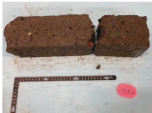
写真2 1960年代の施工法で作成した供試体劣化状況 13) (72サイクル)

実際に1960年代の施工要領 11)12) をもとにコンクリートを作成し、それらに対し「JIS A1148コンクリートの凍結融解試験方法水中凍結融解試験方法」を実施した結果、コンクリートの凍結融解抵抗性が低いことが明らかとなった 13) 。以上より、モルタルによる保護性能が十分ではなく、さらにコンクリートも凍結融解抵抗性が低いため、グレードが大きくなったと言える。複