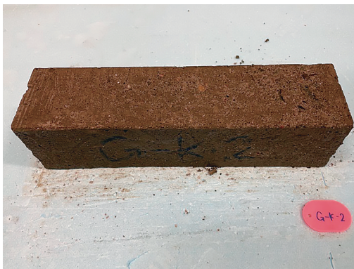
写真1 現在の施工法で作成した供試体劣化状況 13) (72サイクル)