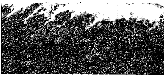
写真 3-2 「野焼き」状態の廃棄物処分場 (ウラジオストク市)

る環境汚染が深刻に懸念される状態である(写真 3-2)。将来的に、3-3 で紹介したような大量の日本製中古自動車が廃棄される時代が来れば、この問題はいつそう深刻化する恐れがある。