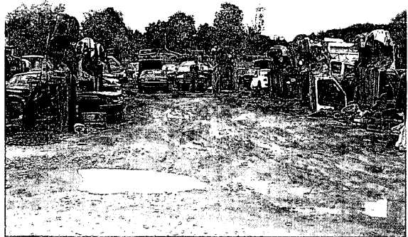
写真 3-1 ハーフカットされた車輛がならぶ （バレーエリ・ノーディング社）

中古部品を希望する客は自由に敷地内に立ち入ることができ、並べられている部品や、廃車に付属している部品についてその場で値段を交渉し購入する。最終的に余剰となった商品については、再資源化のため、リサイクル業者に無償で運んでいってもらう。その他解体プロセスで発生した廃棄物については市内の廃棄物処分場へ運んでいるとのことであった。