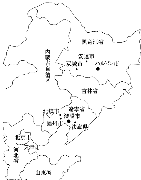
図1 現地調査カ所位置図

本稿は、中国における農民專業合作經濟組織の誕生から「農民專業合作社法」の制定に至る背景や経過を整理した上で、農民專業合